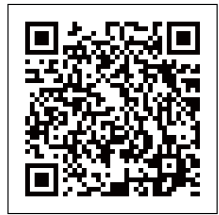
▲民事調停について