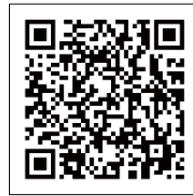
▲家事調停について