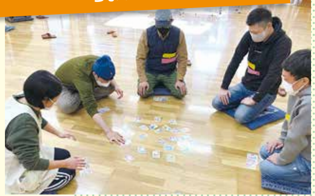
12月5日 まめっこ ちょっと早いおやじのお正月