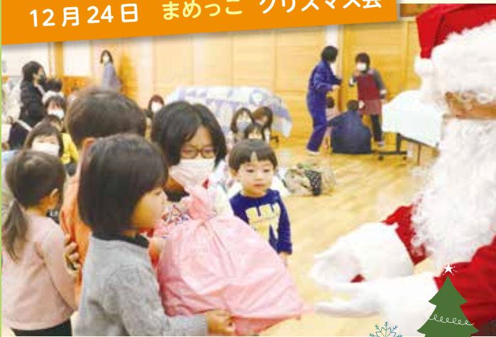
12月24日 まめっこ クリスマス会