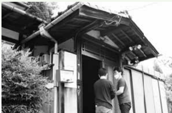
▲空き家所有者と物件の確認をする様子

繰り返しになりますが、空き家を手放せない理由として「年末年始やお盆のときに親戚が集まる」「片付けができていない」「雨漏り等があり状態が良くない」等、いろいろあると思います。しかし、家の不具合や家財処分に関しては大きく支障にならない場合が多いです。こういった理由で悩んでいる方がいらつしゃいましたら、まずはお気軽にお声がけください。これまでに扱った事例の紹介もできますので、解決策を一緒に考えてみませんか！