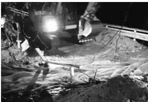
▲平成30年8月豪雨災害の矢垂沢の様子