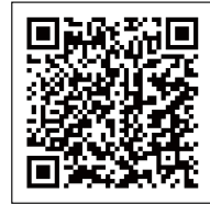
▲長野県 HP 「狩猟免許試験のお知らせ」