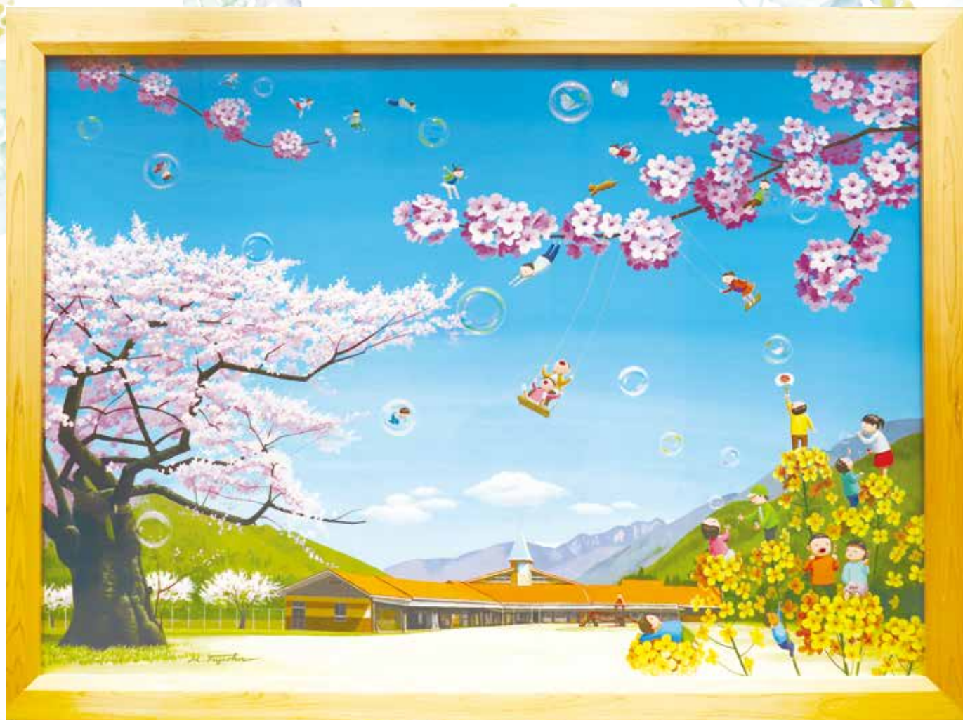
「シャボン玉で遊ぶ」 藤岡牧夫さん作