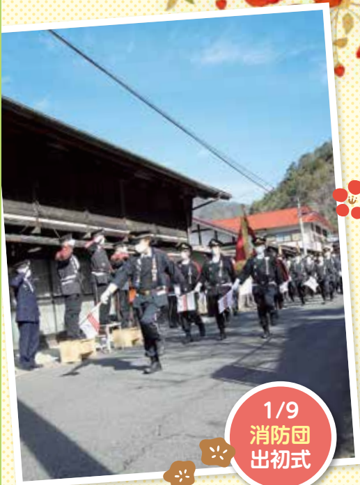
1/9 消防団 出初式