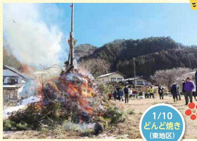
1/10 どんど焼き (東地区)