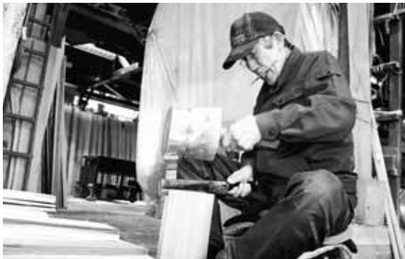
▲「分取り」をする様子