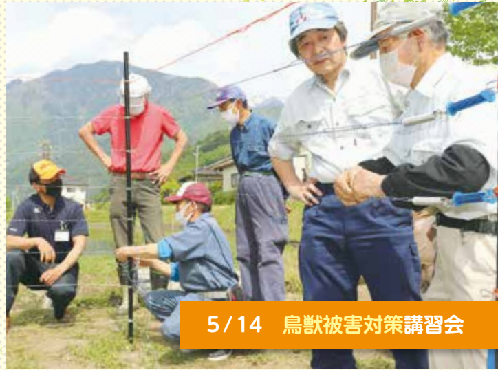
5/14 鳥獣被害対策講習会