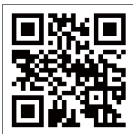
▲ 母子手帳アプリ「母子モ」

『すくすく☆おおくわナビ』は、スマートフォン等で利用できるサービスです。妊娠経過と子どもの健康データの記録や予防接種や健診のスケジュール管理、離れた地域に住む祖父母など家族との情報共有ができます。村からの母子保健事業に関する通知の受け取りなど、子育てに役立つ便利な機能が充実しています。母子手帳と併せてお使いください。