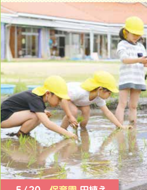
5/20 保育園 田植え