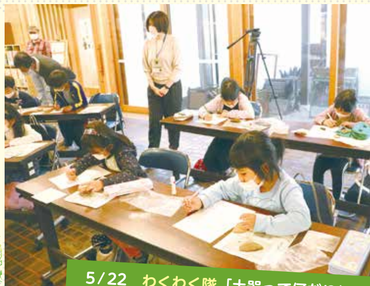
5/22 わくわく隊「土器って何だ!？」