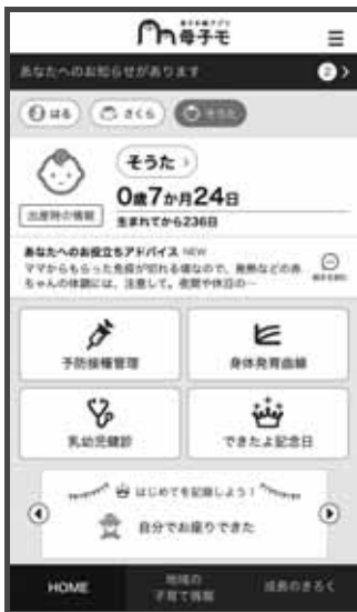
▲ 「母子モ」のサンプル画面