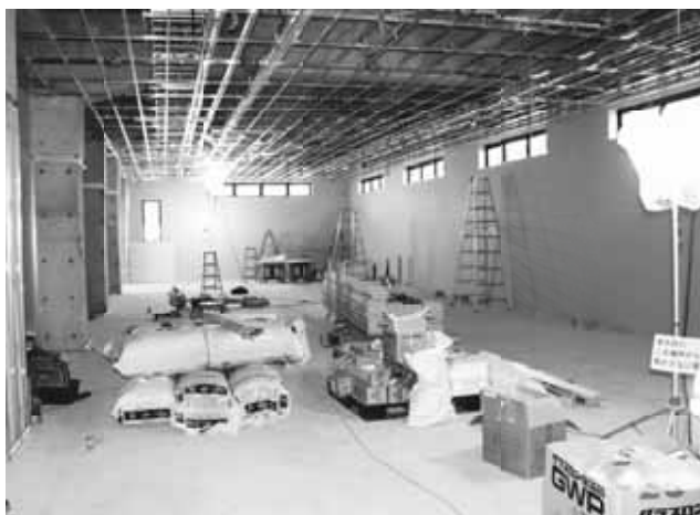
▲ 1階 図書館

付属棟は機械室や備品倉庫、防災倉庫、公用車庫の建設を予定しています。現在は機械室が完成し、公用車庫を建設中です。備品倉庫と防災倉庫は9月中に着工します。新庁舎建設工事に合わせて、村道中学校東線の改良工事を実施しています。この道路は、来庁者の増加が見込まれるため、アクセス道路として安全に通行できる幅員を確保します。3月末供用開始に向けて施工中です。