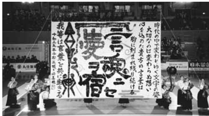
▲ 松本蟻ヶ崎高校の作品