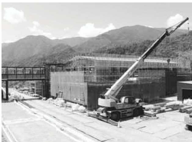
▲ 外観と村道中学校東線