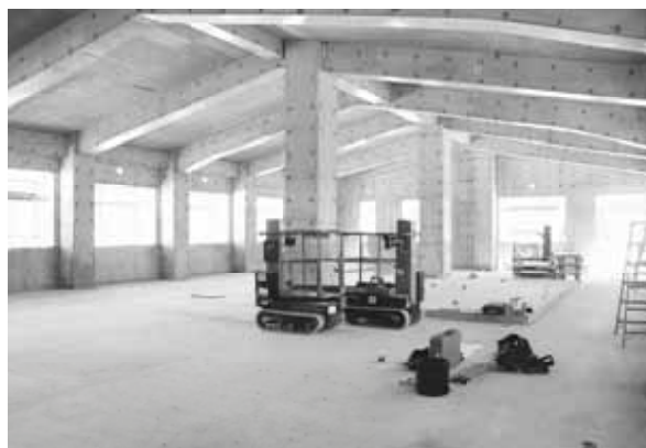
▲ 2階 特別会議室、小会議室等