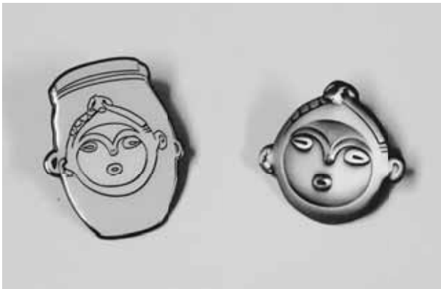
▲ピンバッジ（右は金色と銅色の2種類あり）