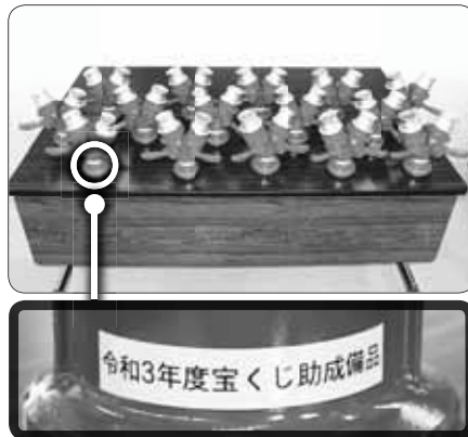
▲分岐ボールバルブ