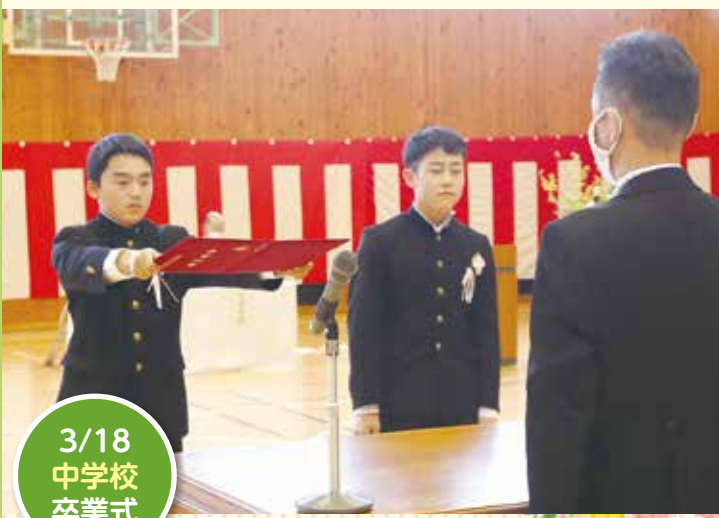
3/18 中学校 卒業式