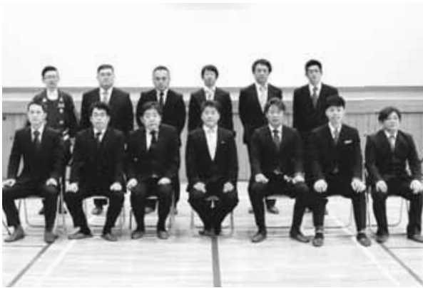
▲受賞者(表彰伝達式参加者)