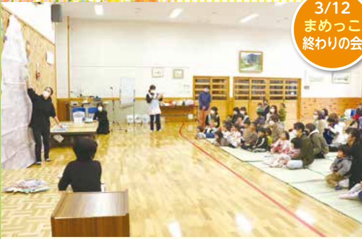
3/12 まめっこ 終わりの会