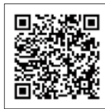
▲マイナポイント専用サイト

制度の詳細は、QRコードでマイナポイント専用サイトにアクセスするか、役場危機管理係に問い合わせください。