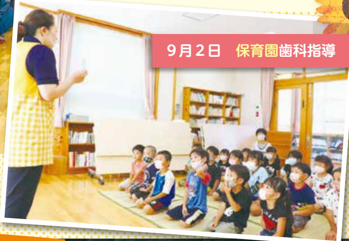
9月2日 保育園歯科指導