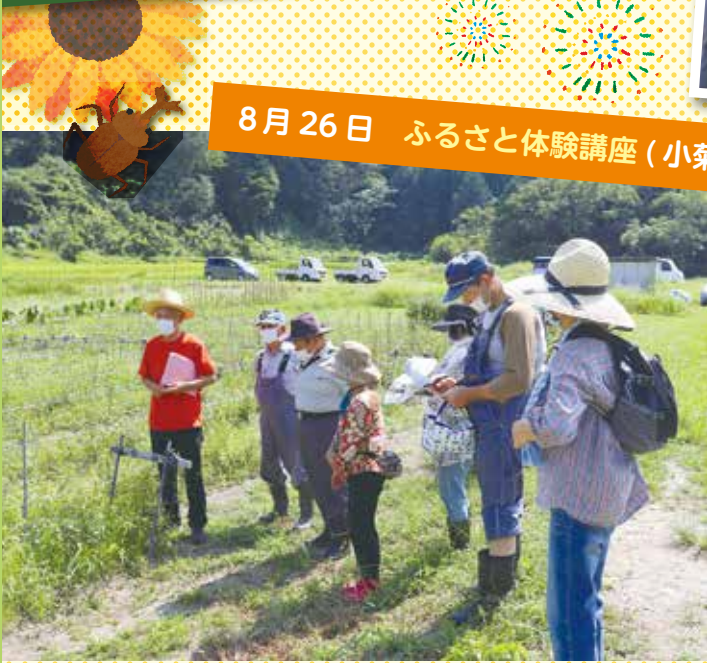
8月26日 ふるさと体験講座(小菊栽培)