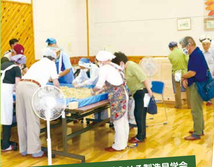
8月2日 定勝寺納豆を蘇らせる製造見学会