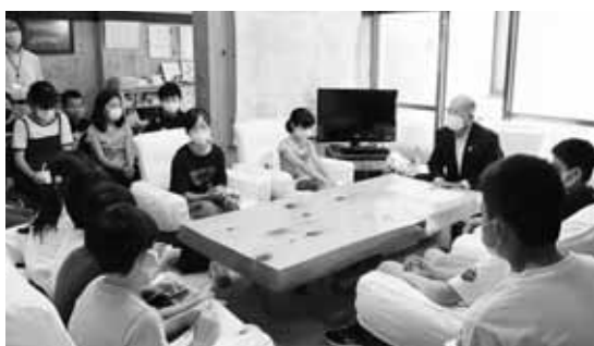
▲対話をする小学生と村長

村長への質問では、病害虫によるナラ枯れ被害や新型コロナウイルス感染症に関する質問があり、未来を担う子どもたちの社会問題への関心の高さがうかがえました。