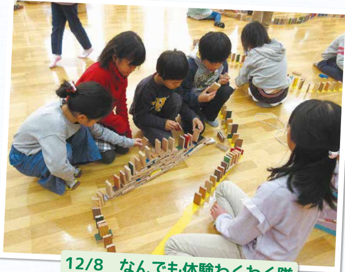
12/8 なんでも体験わくわく隊