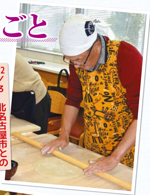
12/3 北名古屋市のそば打ち交流会