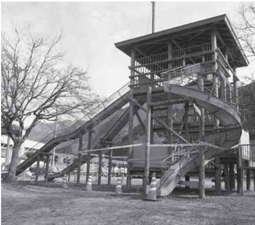
▲使用禁止になった擬木トリデ