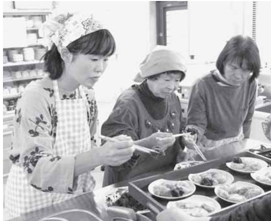
▲完成したとちもちを盛り付ける様子