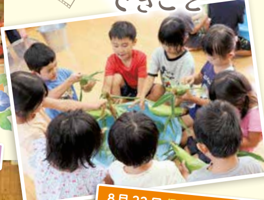
8月22日 保育園 JA木曾からトウモロコシをいただきました