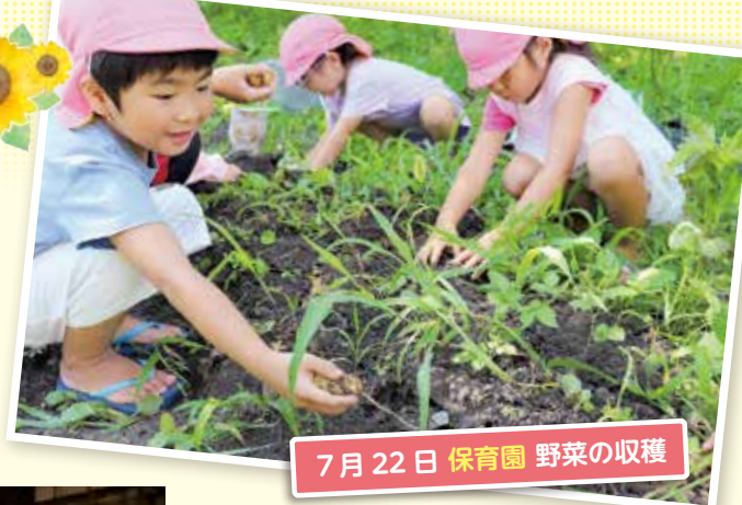
7月22日 保育園 野菜の収穫