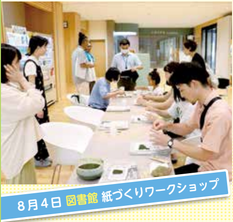
8月4日 図書館 紙づくりワークショップ