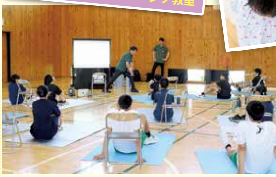
8月9日 コンディショニング教室