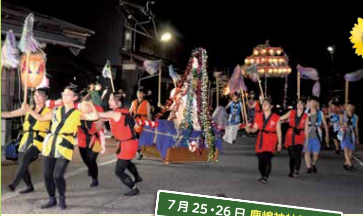
7月25・26日 鹿嶋神社例大祭