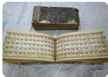
明治期の漢和辞書