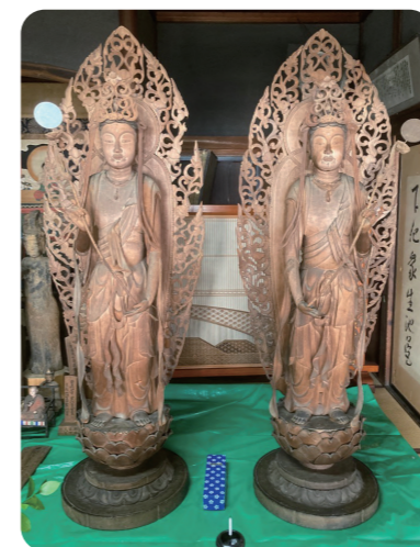
〈左〉月光菩薩像 〈右〉日光菩薩像

日光・月光菩薩像は昭和51年、大桑村有形文化財に指定され、池口寺本尊である薬師如来坐像の左右に配する菩薩立像です。